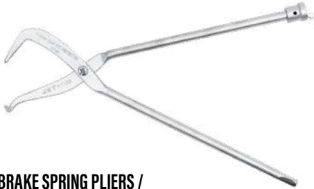
BRAKE SPRING PLIERS / PINCES À RESSORT DE FREIN