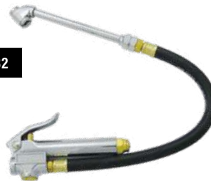
AIR LINE INFLATOR WITH TIRE GAUGE / GONFLEUR DE PNEUS AVEC MANOMÈTRE