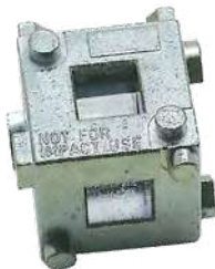
REAR DISC BRAKE CALIPER TOOL / OUTIL POUR ÉTRIER DE FREIN À DISQUE ARRIÈRE