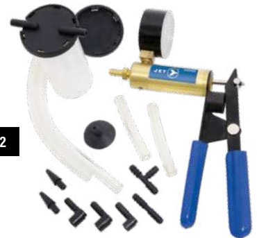
DELUXE VACUUM PUMP WITH BLEEDER KIT / POMPE À VIDE DE LUXE AVEC KIT DE PURGE