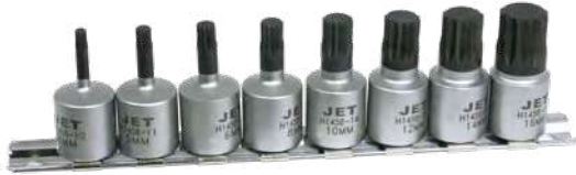
8-PC 3/8" DR TRIPLE SQUARE BIT SET / JEU DE 8 EMBOUTS À TRIPLE CARRÉS À PRISE DE 3/8 PO SIZE RANGE: 4 - 16 MM