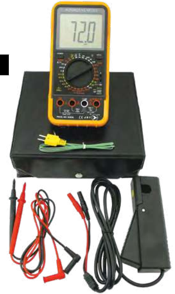
FULL-RANGE DIGITAL AUTOMOTIVE MULTIMETER KIT / TROSSE DE MULTIMÈTRE NUMÉRIQUE AUTOMOBILE À PLAGE COMPLÈTE