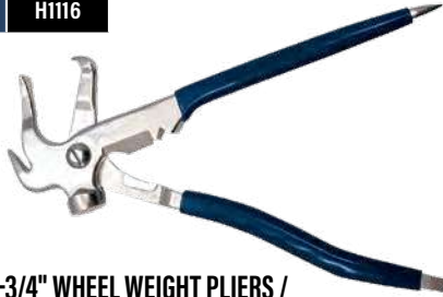
9-3/4" WHEEL WEIGHT PLIERS / PINCES POUR MASSES D'ÉQUILIBRAGE DE ROUE DE 9-3/4 PO