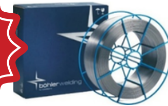
FIL FLUXCORE Q71RC 1/16 BOLHER No produit Q71RCM15 1/16 Quantité disponible: 150