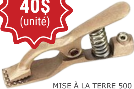
MISE À LA TERRE 500 AMPS BRASS HD No produit OMC-500 Quantité disponible: 124