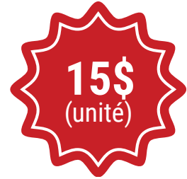
TIP PLASMA No produit 8-7515 Quantité disponible: 31

DES ÉCONOMIES RÉELLES ! DU STOCK PRÊT À PARTIR !