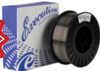
FIL MAX WEAR .045 No produit MAXWEAR045 Quantité disponible: 28