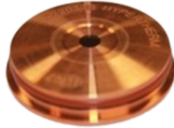
SHIELD 80A HYPER THERM No produit HYP220338 Quantité disponible: 61