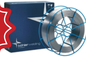
FIL FLUXCORE Q71RC 052 BOHLER No produit Q71RCM15 052 Quantité disponible: 210