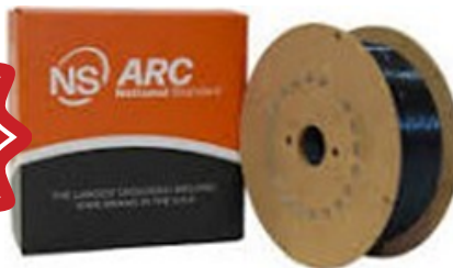
FIL MC70C X 045/33LBS NS No produit 622-412-163 Quantité disponible: 60